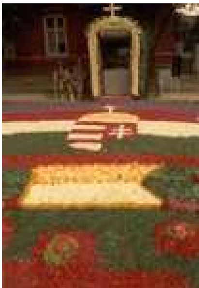
Úrnapi oltár Csömrön

Ne feledd Őt sohase, Hiszen érted jött A földre, Bűneidet megbocsátja, Lelked hívja a Mennyországba!