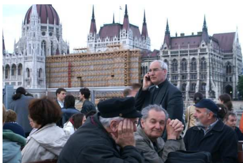
Az Országház előtt