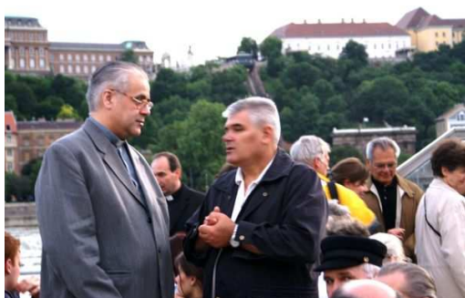
A budai várnál